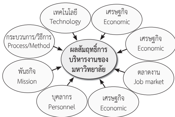
ภาพที่ 2 : แสดงแนวทางการเสริมสร้างผลสัมฤทธิ์การบริหารงานของ มหาวิทยาลัยในกำกับของรัฐ เขตกรุงเทพมหานคร

2.4 ด้านตลาดงาน การจัดกิจกรรมอบรมพัฒนาทักษะเพื่อให้นิสิต/ นักศึกษามีทักษะตามความต้องการของตลาดงาน และสามารถนำไปปฏิบัติได้ จริงและนำไปประยุกต์ใช้ให้เกิดประโยชน์ในการทำงานโดยความร่วมมือจาก ผู้ใช้บัณฑิตหรือสถานประกอบการโดยสามารถแสดงในภาพที่ 2 ดังนี้